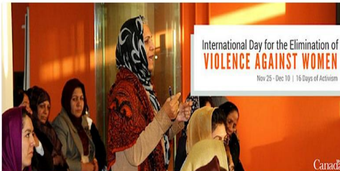
Canada's offices abroad – working to end violence against women