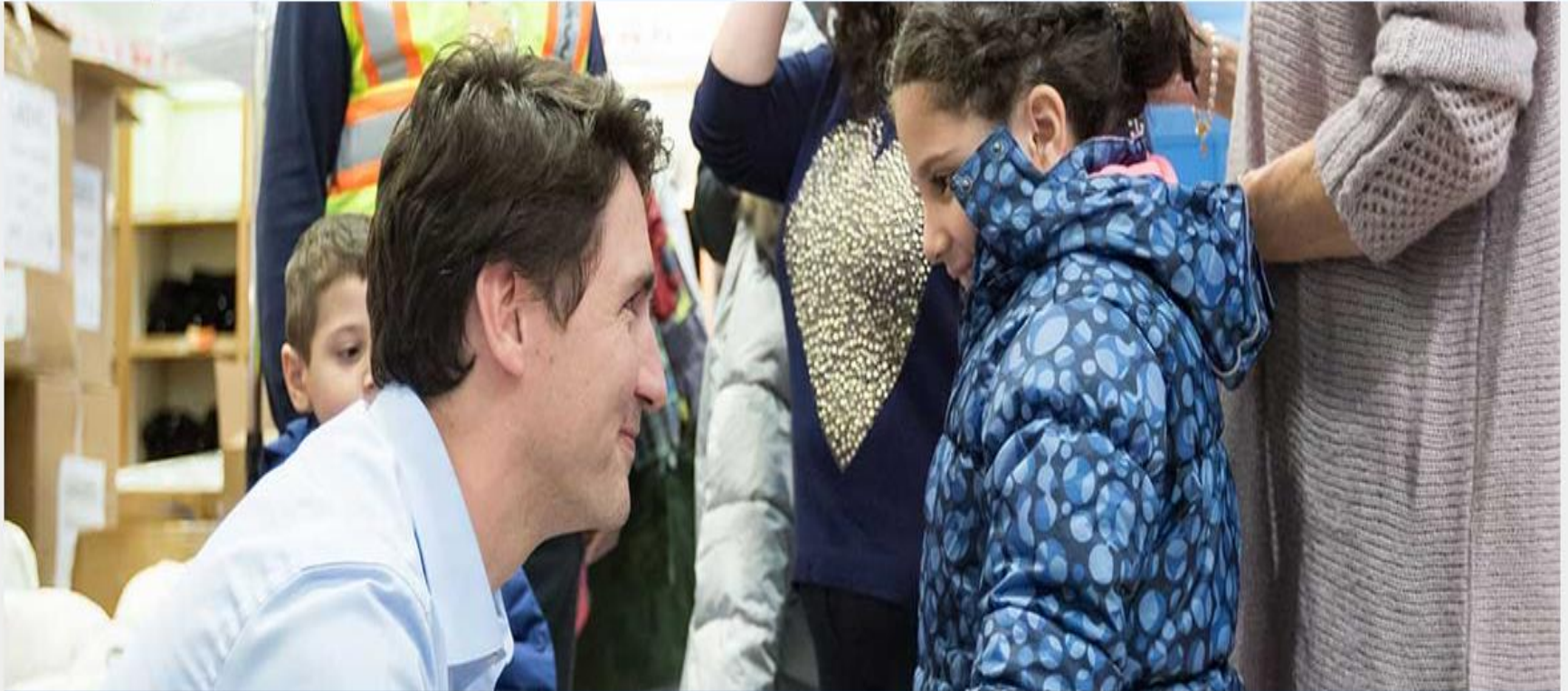
Statement by the Prime Minister of Canada on the arrival of Syrian refugees